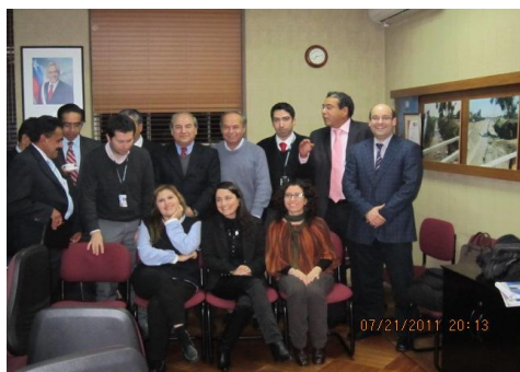
Delegación mexicana junto al equipo de trabajo del Departamento de Programas Sanitarios de la Dirección de Obras Hidráulicas del MOP.