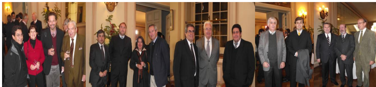
Socios y asistentes a charla “Desarrollo Eléctrico: Desafío a corto y Mediano Plazo”

El ex Secretario Ejecutivo de la CNE y Socio-Director de Synex Ingenieros Consultores, expuso sobre el “Desarrollo Eléctrico: Desafío a corto y Mediano Plazo”, alocución que la asamblea constituida por más de 50 especialistas valoró positivamente generándose un ambiente de debate y enriquecimiento para los asistentes y para el sector.